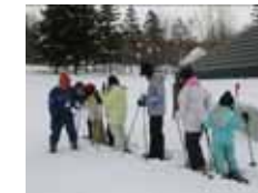
<スノーシュー体験>