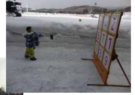
<ストラックアウトゲーム>