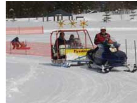
<スノーモビル体験>