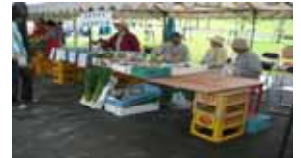
地域農産物等の販売