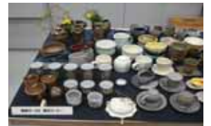
工芸品等の展示・即売会