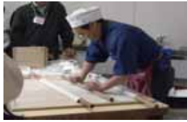
名寄地区手打ちそば愛好会による 手打ちそば実演