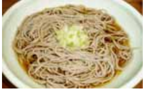
サンピラーパーク産 手打ちそば販売