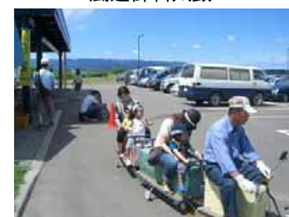
ミニエクスプレス