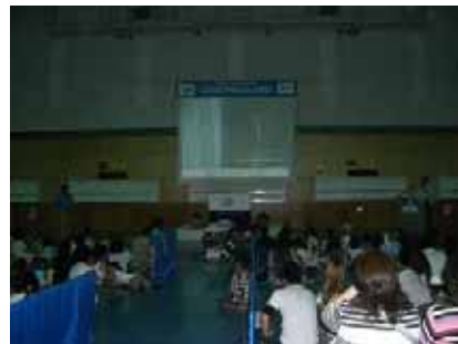
宇宙のふしぎ発見