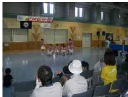
あすば LOVE キッズ