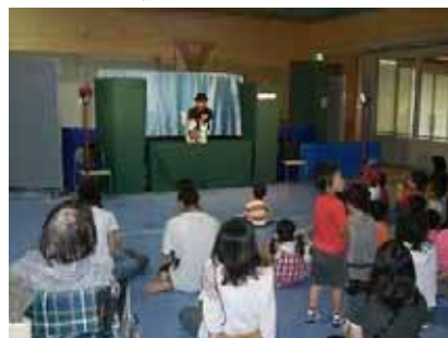
クレヨンカンパニー