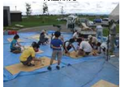
とんとんコーナー