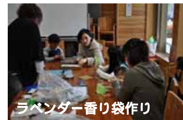
ラベンダー香り袋作り