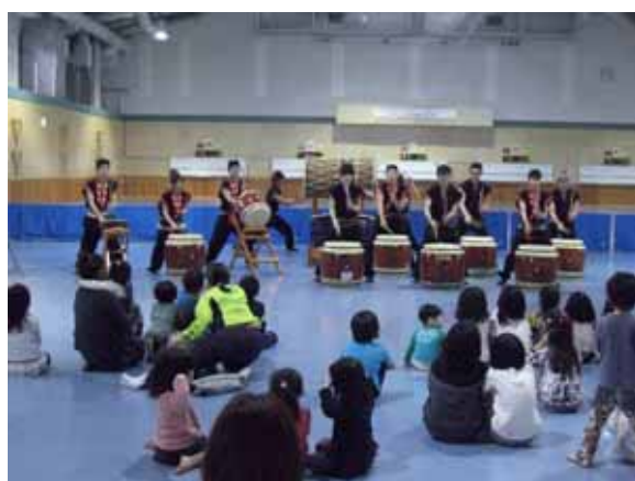
屋内では各種イベント開催！