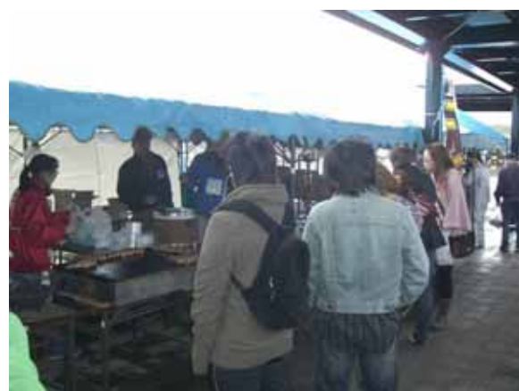
フードゾーン「北のマルシェ」