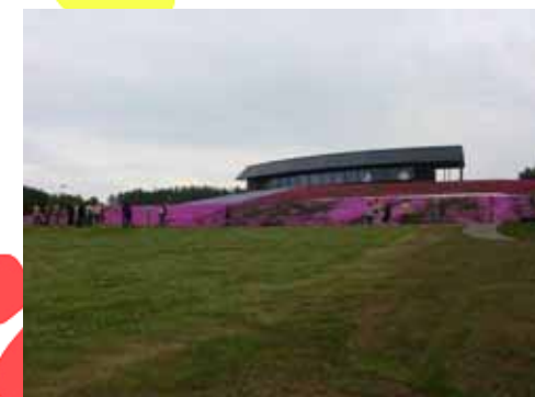
レストハウスの芝桜を見学