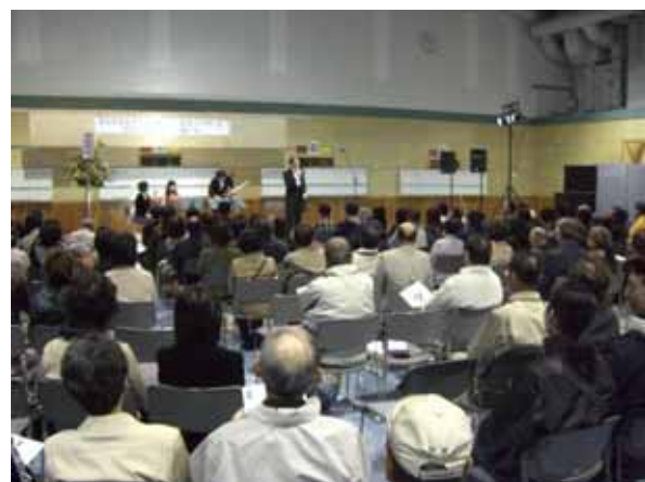
演奏に聴き入るお客さん

「日フィル弦楽四重奏」コンサートを29日きたすばるで。30日は多目的ホールオープンイベントとして交流館で開催しました。