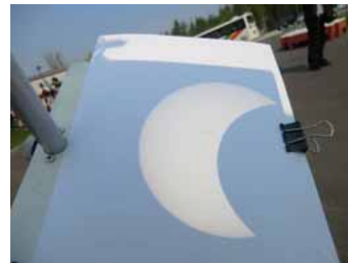
金環日食（部分日食）5月21日

大気中の氷粒に、太陽光が屈折し、ほぼ水平な虹が見える光化学現象で、国内では年に数十回観測される様です。交流館前からの撮影です。