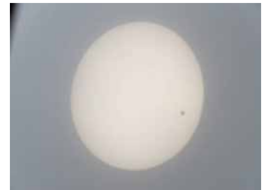
金星の太陽面通過 6月6日