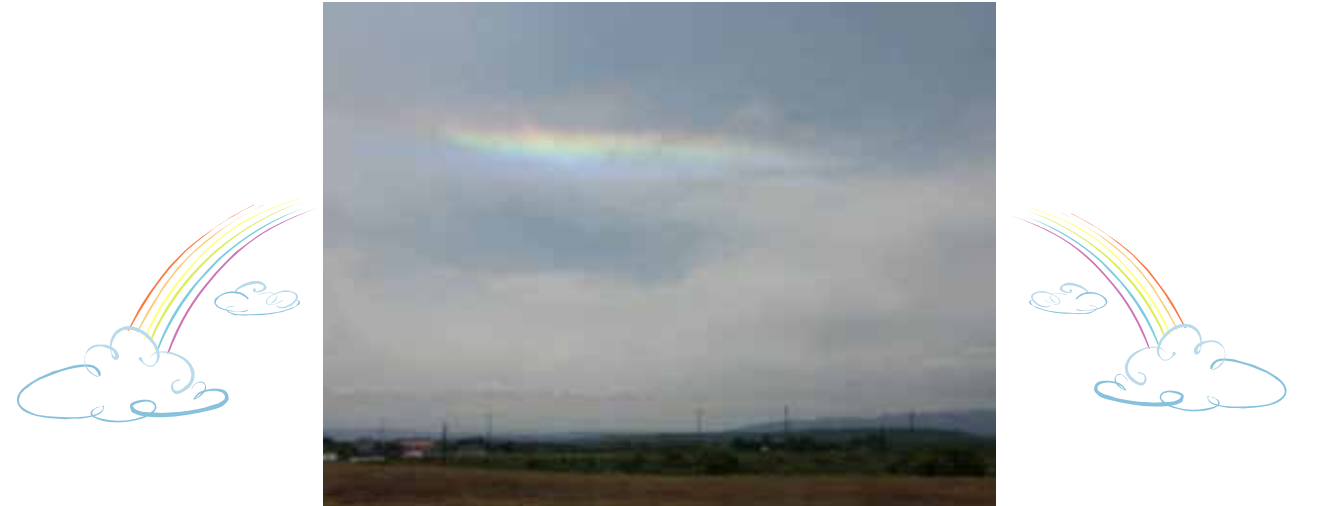
環水平アーク 6月13日撮影

大気中の氷粒に、太陽光が屈折し、ほぼ水平な虹が見える光化学現象で、国内では年に数十回観測される様です。交流館前からの撮影です。