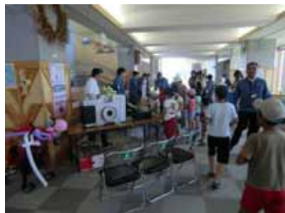
北海道電力コーナー