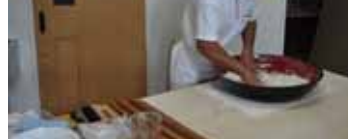
手打ちそば コーナー