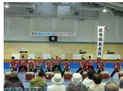
名寄駐屯地朔北太鼓