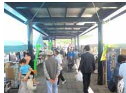
地域の物産販売コーナー