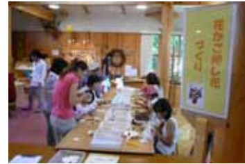
花かご押し花づくり

8月26日(日)なよろ産業まつりに合わせ、第10回「木・草花ふれあいフェスティバル2012」を道立トムテ文化の森で開催いたしました。720名の来場者に草木を使った「ものづくり」などで自然と触れ合っていました。