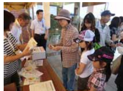
スタンプラリー受付