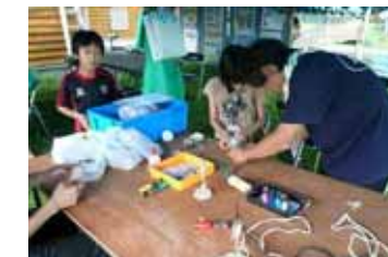
ぶんぶんゴマづくり