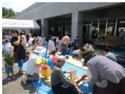
とんとん大工さん体験