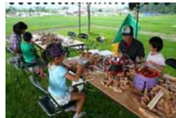
オリジナル作品づくり