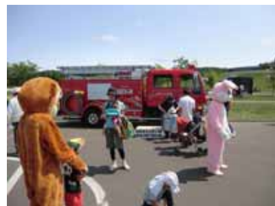
名寄消防コーナー