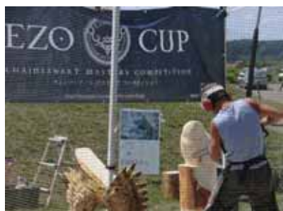
チェーンソーアート