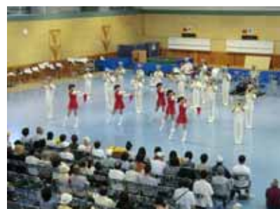
北海道警察音楽隊