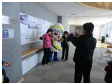
<なよろうと記念撮影>