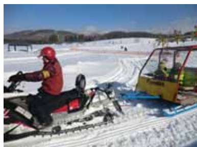
<スノーモビル体験>