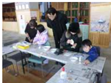
<香り帽子作り体験>