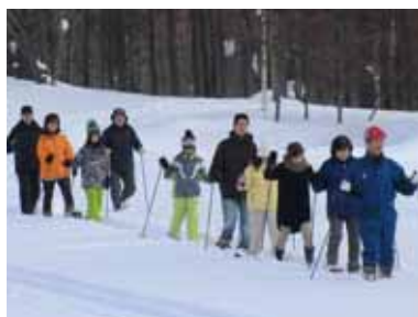
<スノーシュー体験>