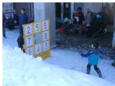
<ストラックアウトゲーム>