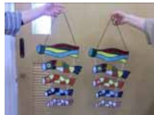
スタンドグラス講座