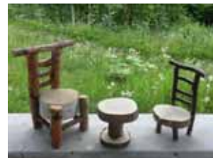
木工クラフト講座