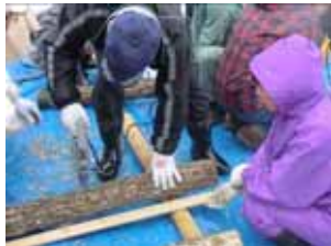
きのこ栽培講習会