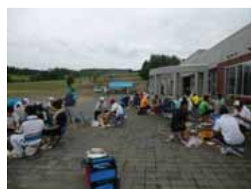
<煮込みジンギスカン>