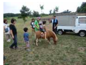
<動物ふれ愛ランド>