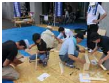
<とんとん大工さん>