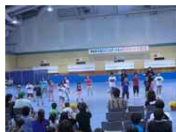
<ストリートダンス>