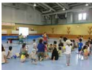
<ピアノ&エレクトーン>