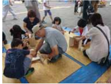
<とんとん大工さん>