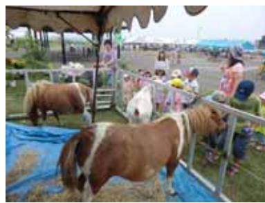
<動物ふれ愛ランド>