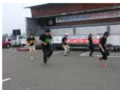
<ダンスパフォーマンス>