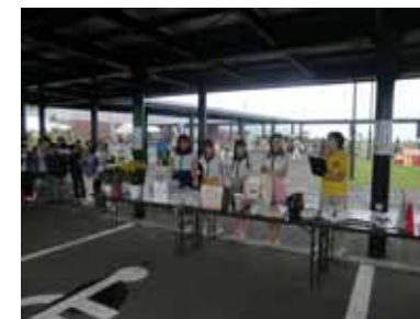
<スタンプラリー抽選会>