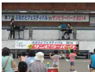
<ピアノ&エレクトーンコンサート>