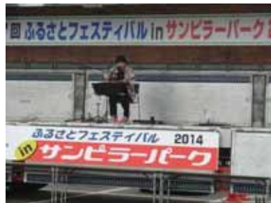
<むらなが吟コンサート>