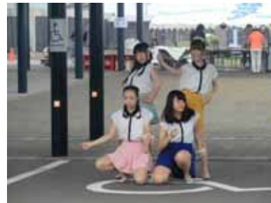
<アスパ LOVE 7 4 6 ライブ>