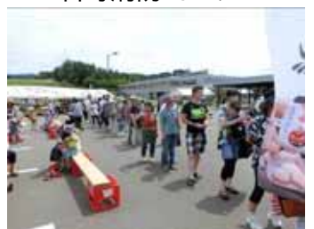
<スタンプラリー投函>