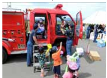
<名寄消防コーナー>