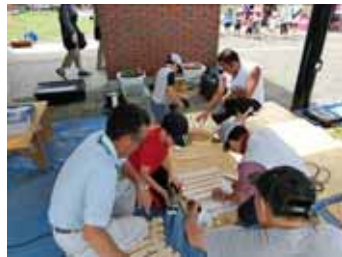
<とんとん大工さん>