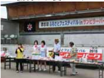
<スタンプラリー抽選会>