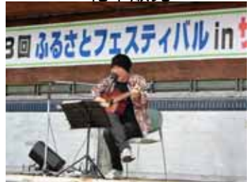
<むらなが吟コンサート>