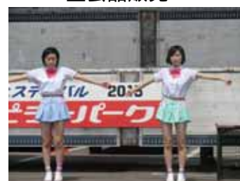
<なよろアスパ恋(ラブ)>