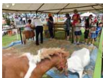
<動物ふれ愛ランド>